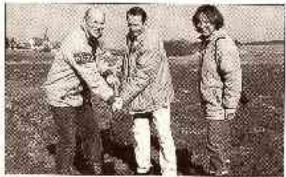
Die Baugenehmigung von der Polizei beantragt, die Baustelle ist die Baustelle, die die Baugenehmigung von der Polizei beantragt.

Der zum Bumerang für die Schilfkläranlagenbefürworter gewordene Bericht in der Main-Post vom 11.3.2003.