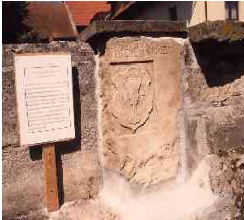
Einen Ehrenplatz in der 1589 errichteten Kirchhofmauer erhielt der Grabstein von Pfarrer Johann Rauschart, der 1994 entdeckt wurde.

Nach 1727 geschahen noch einige Verrichtungen des evangelischen Pfarrers von Sulzdorf, aber mit „Verdruß der Obrigkeit“. Schließlich wurden diese dem Sulzdorfer Pfarrer vom Sternberger Dorfherrn verboten. Mit oder ohne Erfolg ist unbekannt. Nachdem 1755 die Schule (das Zimmerauer Schulhaus stand ehemals auf dem Kirchhof, dessen Grundmauern sind heute noch auf der rechten Seite zu erkennen) nach Sternberg kam und man dort wohl ein neues Schulhaus bezog (das heutige Wohnhaus der Familie Glutig neben der Kirche), wurden dem katholischen Schulmeister auch die Zimmerauer Abgaben für das Schulhalten überschrieben.