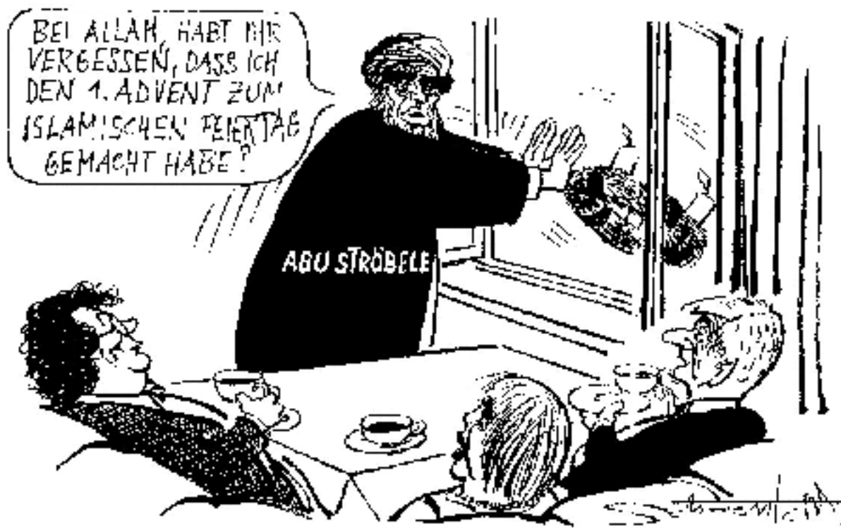
- Karikatur des Monats -