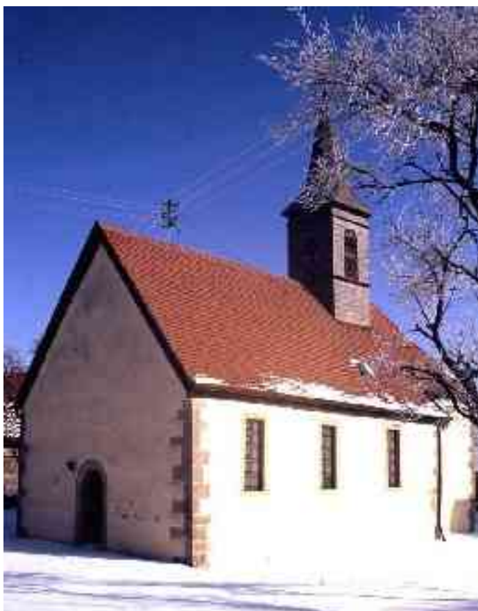
Die kath. Filialkirche in Zimmerau bedarf einer Renovierung.